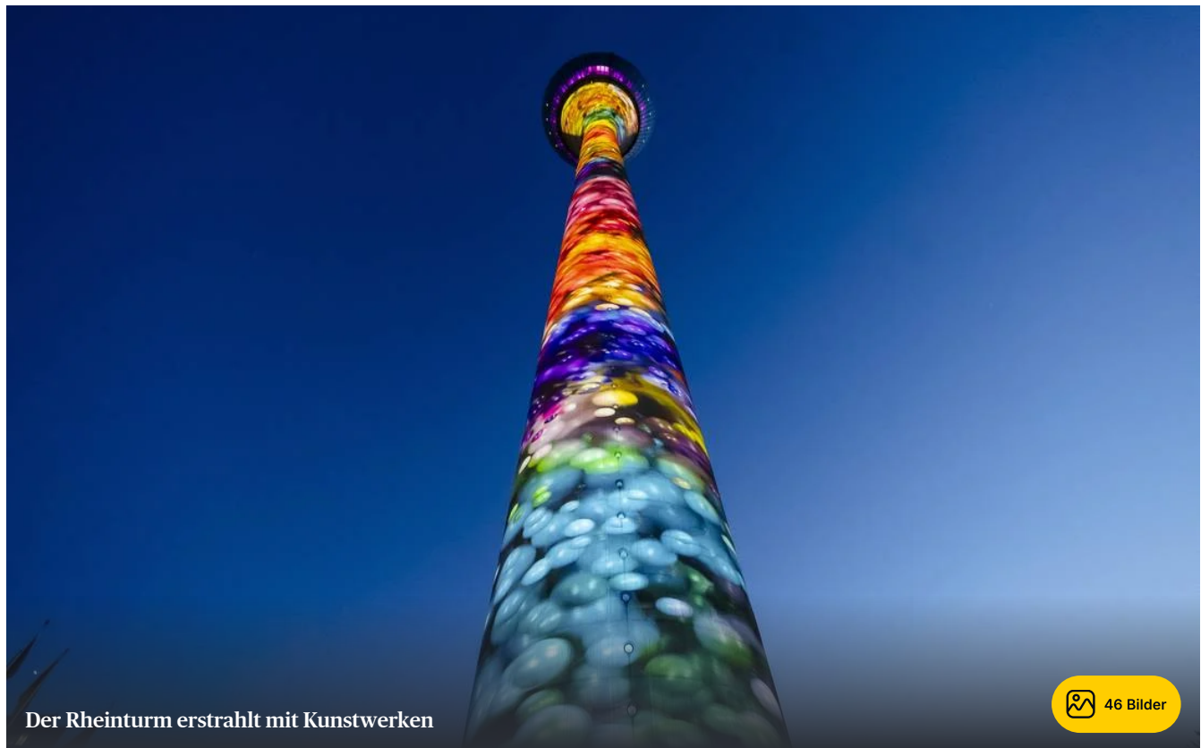
Der Rheinturm erstrahlt mit Kunstwerken

25.04.2025 , 22:41 Uhr · 4 Minuten Lesezeit